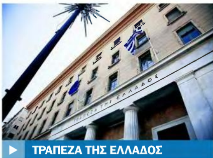
▶ ΤΡΑΠΕΖΑ ΤΗΣ ΕΛΛΑΔΟΣ