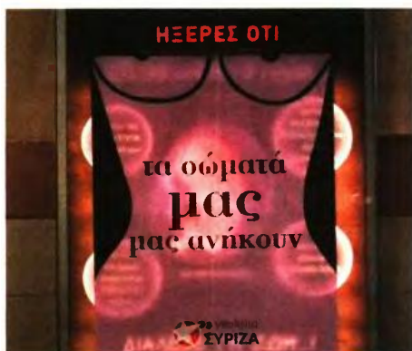
Φωτογραφία από την παρέμβαση της Νεολαίας ΣΥΡΙΖΑ στο μετρό Μεταξουργείου προτού αποσυρθούν οι αφίσες κατά των αμβλώσεων

Παρουσία εκπροσώπου του Αρχιεπισκόπου Ιερώνυμου αλλά και πλήθους παπάδων, καθηγητών και ευσεβών, μεταξύ των οποίων και ο Ηλίας Παναγιώταρος, γνωστό πρωτοκλασάτο στέλεχος της Χρυσής Αυγής, πραγματοποιήθηκε η πρώτη ημερίδα του κινήματος «Αφήστε με να ζήσω» στο Πολεμικό Μουσείο στις 6 Μαΐου του 2018