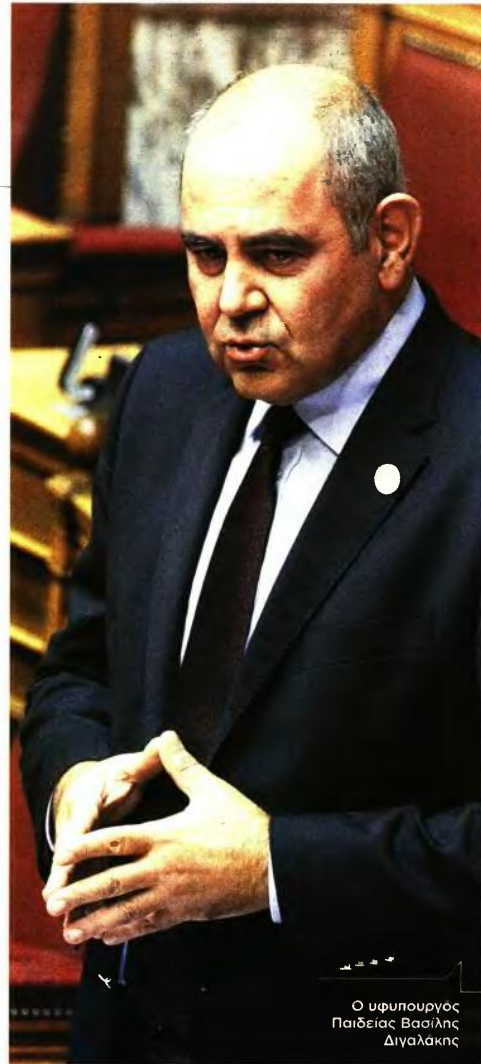
Ο υφυπουργός Παιδείας Βασίλης Διγαλάκης

«Πρώτα απ' όλα, η χωριστή εκλογή πρυτάνη και αντιπρυτάνεων είναι ένα σχήμα που δεν βοηθάει ένα πανεπιστήμιο να κυβερνηθεί. Αν δεν υπάρχει συναντίληψη για τον σχεδιασμό και τον τρόπο εφαρμογής της πολιτικής, το αποτέλεσμα είναι η στασιμότητα και η εσωστρέφεια. Συνεπώς, προκρίνουμε να τίθεται σε ενιαίο ψηφοδέλτιο η εκλογή πρύτανη και αντιπρυτάνεων ή, εναλλακτικά, ο εκλεγμένος πρύτανης να ορίζει αναπληρωτές. Σε κάθε περίπτωση, οι εκλογές θα διενεργούνται με ηλεκτρονική ψηφοφορία. Οι πρυτανικές αρχές θα εξακολουθήσουν να έχουν στην αρμοδιότητά τους τη διοίκηση του πανεπιστημίου, ενώ η Σύγκλητος θα είναι το ανώτατο όργανο του πανεπιστημίου, ιδιαίτερα όσον αφορά τα ακαδημαϊκά θέματα. Σχετικά με τα Συμβούλια, βρισκόμαστε σε φάση διαβούλευσης αυτή τη στιγμή. Ωστόσο, ο ρόλος τους θα είναι