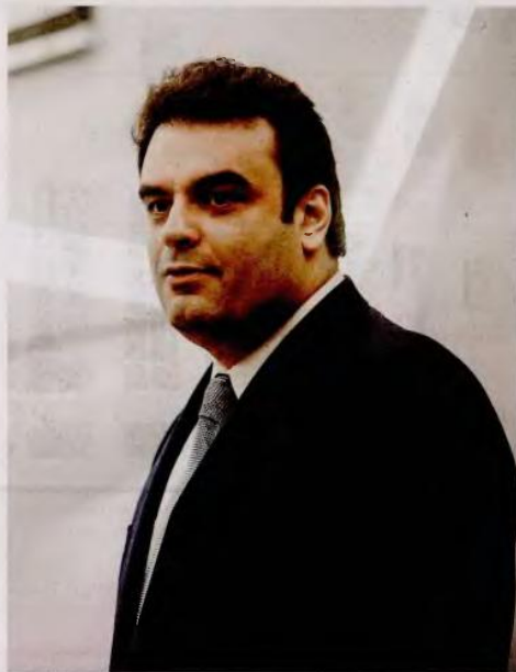
«Κινητό» πως θα χρειαστεί περίπου μία διετία για να πραγματοποιήσουμε τις αλλαγές», λέει ο υπουργός Ψηφιακής Διακυβέρνησης Κυρ. Πιερρακάκης.

– Έχετε αναφερθεί ότι νέα ταυτότητα. Πότε θα την αποκτήσουμε; – Ο διαγωνισμός έχει ήδη προ-