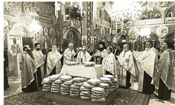
Ο Θεοφιλέστατος Επίσκοπος Κερνίτσας κ. Χρυσάνθος τέλεσε τη Θεία Λειτουργία στον πανηγυρίζοντα Ναό Αγίου Βασιλείου Βραχναϊκών

νεργάτες του, καλή και ευλογημένη χρονιά και κάθε δωρεά παρά Κυρίου. Μετά ταύτα μετέβη στην έδρα της Περιφέρειας Δυτικής Ελλάδος, όπου ευλόγησε και εκεί την Βασιλόπιτα, ευχήθηκε τα δέοντα στον Περιφερειάρχη κ. Νεκτάριο Φαρμάκη, στους αντιπεριφερειάρχες και σε όλους τους εργαζομένους στην Περιφέρεια. Ο Θεοφ. Επίσκοπος Κερνίτσας κ. Χρυσάνθος τέλεσε την Θεία Λειτουργία στον πανηγυρίζοντα Ναό Αγίου Βασιλείου Βραχναϊκών, σε ένα από τους μεγαλύτερους και λαμπρότερους ναούς της Μητροπόλεως και κηρύξε επικαίρω τον θείο λόγο, ενώ μετέφερε και τις πατρικές ευχές και ευλογίες του Σεβασμιωτάτου.