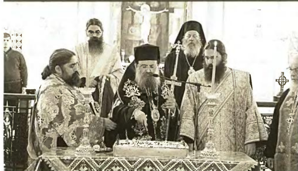
Από τον Εσπερινό και την κοπή της πίτας της Ι.Μ. Πατρών

Την παραμονή της Πρωτοχρονιάς, τελέσθηκε και ο Εσπερινός της εορτής της Περιτομής του Κυρίου και του Μεγάλου Βασιλείου στον Ναό του Αγίου Αποστόλου Ανδρέου, χοροστατούντος του Μητροπο-