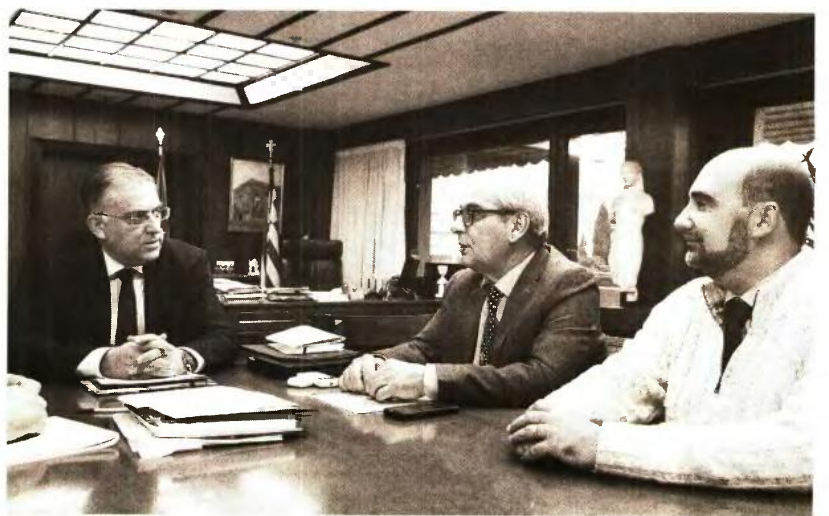
Κατά τη χθεσινή συνάντηση του υπουργού Εσωτερικών κ. Θεοδωρικού με την ΠΟΜΙΔΑ συμφωνήθηκε να δοθεί λύση και στο θέμα των δηλωσέντων κενών και μη ηλεκτροδοτούμενων ακινήτων.

Τ η διαγραφή αναδρομικών χρεώσεων δημοτικών τελών και φόρων που επιβλήθηκαν σε βάρος κλιμάδων ιδιοκτητών ακινήτων όταν αυτοί δήλωσαν στους δήμους τις πραγματικές επιφάνειες των κατοικιών ή άλλων κτισμάτων τους αποφάσισε η κυβέρνηση, βελτιώνοντας ακόμη περισσότερο τις ήδη ευνοϊκές ρυθμίσεις οικειοθελούς συμμόρφωσης που θέσπισε πρόσφατα για τα χρέη προς τους ΟΤΑ.