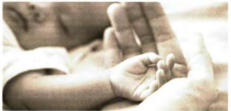
Τα μέτρα στήριξης της οικογένειας δεν αρκούν, όσο οι γυναίκες αργούν να τεκνοποιήσουν, αναφέρεται σε μελέτη του Π.Θ.

Σύμφωνα με τον ίδιο, οι γεννήσεις κάθε χρονιά είναι προϊόν δύο ανεξάρτητων παραγόντων, του πλήθους των γυναικών αναπαραγωγικής ηλικίας και του τελικού αριθμού των παιδιών που θα κάνουν. Το πλήθος των γυναικών αναπαραγωγικής ηλικίας της αμέσως επόμενης δεκαετίας, χωρίς ριζικές αλλαγές δεν αναμένεται να αυξηθεί, αλλά αντίθετως θα μει-