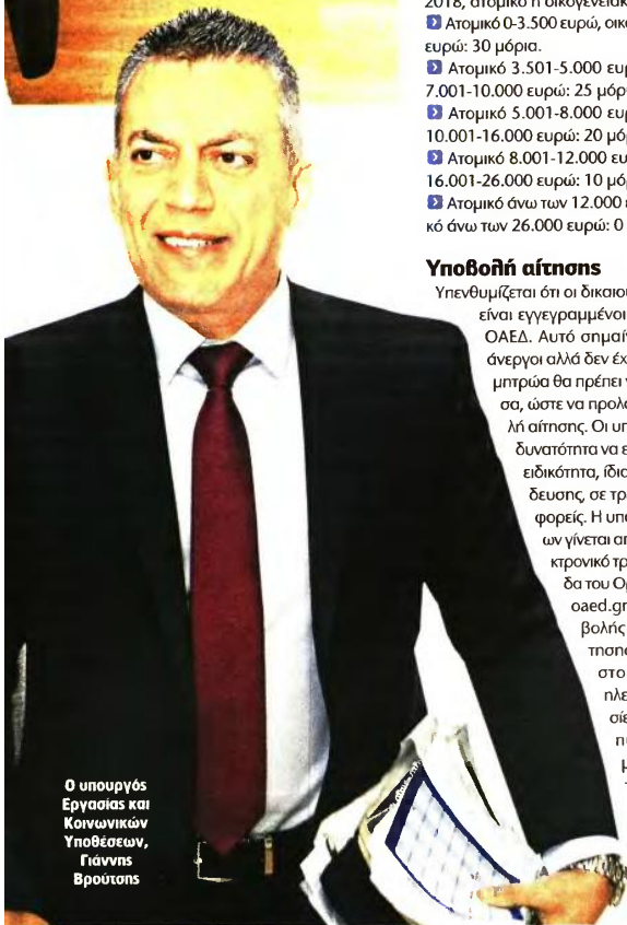
Ο υπουργός Εργασίας και Κοινωνικών Υποθέσεων, Γιάννης Βρούτσος

7. Γονέας προστατευόμενου ή προστατευόμενων τέκνων ΑΜΕΑ, ανηλίκων ή και ενηλίκων, με ποσοστό αναπηρίας 67% και άνω.