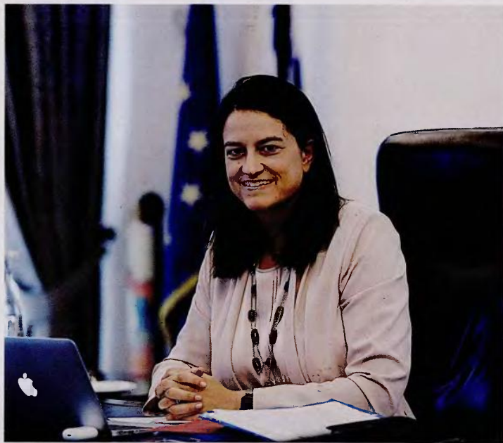
Το πανεπιστήμιο δεν μπορεί να είναι εστίες ανομιίας και εγκληματικότητας, τονίζει η υπουργός Παιδείας Νίκη Κεραμέως.

– Μιλώτε για προσθήκη νέων δεξιοτήτων στο σχολείο. Πώς θα γίνει αυτό; Με νέα μαθήματα; Θα αυξηθούν οι ώρες διδασκαλίας στο σχολείο; Θα αυξομειωθούν