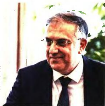
Ο υπουργός Εσωτερικών Τάκης Θεοδωρικάκος

Η ΝΕΑ ΑΔΕΙΑ μετ' αποδοχών θα προστεθεί στον υπάρχοντα υπαλληλικό κώδικα με εμπλουτισμό του άρθρου 50. Στο άρθρο αυτό αναλύονται διεξοδικά οι ειδικές άδειες που δικαιούνται οι δημόσιοι υπάλληλοι. Είναι σε αυτόν όπου μεταξύ άλλων προβλέπονται η πενήνημερη άδεια γάμου, η τριήμερη άδεια λόγω θανάτου συζύγου ή συγγενούς β' βαθμού, η διήμερη άδεια σε άνδρες υπαλλήλους που αποκτούν παιδί, η άδεια για την άσκηση του εκλογικού δικαιώματος, άδειες έως 22 εργάσιμες ημέρες κατ' έτος για υπαλλήλους που οι ίδιοι ή σύζυγός τους ή τέκνο τους πάσχουν από νόσημα που απαιτεί μεταγγίσεις αίματος ή περιοδική νοσηλεία, η εξάμηνη επιπλέον της κανονικής άδεια για υπαλλήλους με ποσοστό αναπηρίας άνω του 50% και η άδεια για όσους λαμβάνουν μέρος σε αιμοδοσία. Στο υπό διαβούλευση νομοσχέδιο, σύμφωνα με πληροφορίες, θα ρυθμίζονται και άλλα ζητήματα που αφορούν το προσωπικό του δημόσιου τομέα. Ανάμεσα σε αυτά προβλέπεται η εξάλειψη μιας ανισότητας εις βάρος των γονέων που έχουν υιοθετήσει παιδιά. Η διάταξη θα ορίζει ότι οι θετοί γονείς θα μπορούν και εκείνοι να αξιοποιήσουν την 9μηνη άδεια ανατροφής τέκνου μέχρι το παιδί τους να κλείσει την ηλικία των τεσσάρων ετών, δυνατότητα που αναγνωρίζεται σήμερα στους δημοσίων υπαλλήλους που έχουν τεκνοποιήσει.