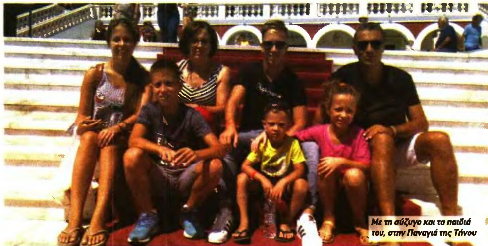
Με τη σύζυγο και τα παιδιά του, στην Παναγιά της Τίνου

«Ζούμε από τον μισθό μου από το Πυροσβεστικό Σώμα συν κάποιο συμπληρωματικό εισόδημα από αγροτικές εργασίες στα κτήματά μου. Συνολικά είμαστε μόνο έξι πυροσβέστες που έχουμε πέντε παιδιά, αφού οι περισσότεροι συναδέλφοί μου πιέζονται οικονομικά πάρα πολύ και έχουν σταματήσει στα τρία, παρότι θα ήθελαν να κάνουν και τέταρτο. Δυστυχώς το πρόβλημα είναι έντονο και στον Σύλλογο, αφού από τους 2.500 εγγεγραμμένους πολύτεκνους, εισφορές αποδίδουν μόνο 700-750. Καταργούμε