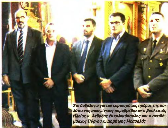
Στη δοξολογία για τον εορτασμό της ημέρας της πολύτεκνης οικογένειας παραβρέθηκαν ο βουλευτής Ηλείας κ. Ανδρέας Νικολακόπουλος και ο αντιδήμαρχος Πύργου κ. Δημήτρης Μεσσαλάς