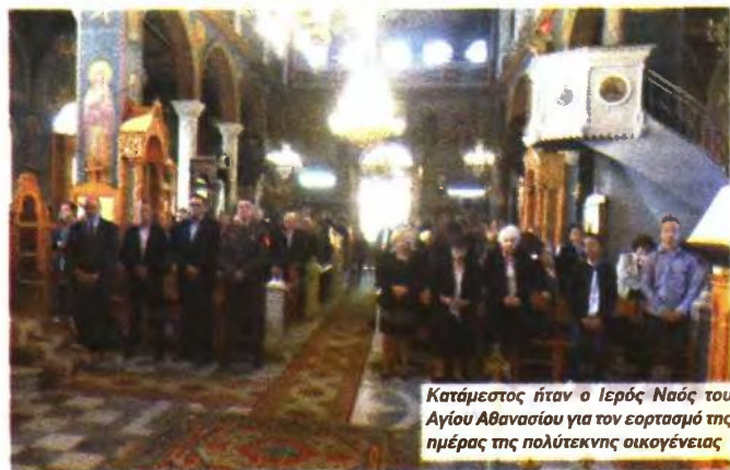
Κατάμεστος ήταν ο Ιερός Ναός του Αγίου Αθανασίου για τον εορτασμό της ημέρας της πολυτέκνης οικογένειας