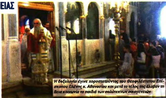
Η δοξολογία έγινε χωροστατούντος του Θεοφιλέστατου Επισκόπου Ωλένης κ. Αθανασίου και μετά το τέλος της έλαβαν τη βεια κοινωνία τα παιδιά των πολυτέκνων οικογενειών

Επεσήμανε μάλιστα ότι από την πρώτη στιγμή ο πρωθυπουργός Κυριάκος Μητσοτάκης και η κυβέρνηση, συνειδητοποιώντας αυτή τη σπουδαιότητα ανακοίνωσαν και τα πρώτα μέτρα στήριξης υπέρ των πολυτέκνων και ειδικότερα το επίδομα 2.000 ευρώ για κάθε παιδί που γεννιέται και το επιπλέον αφορολόγητο για κάθε νέο παιδί. Είναι ένα άμεσο και έμπρακτο ενδιαφέρον που θα συνεχισθεί, είπε ο κ. Νικολακόπουλος.