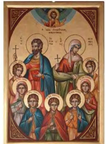
Η οικογένεια των Αγίων Τεραντίου και Νεονίλλης