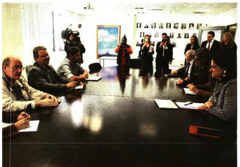
Φωτογραφία από τη χθεσινή συνάντηση στο υπ. Παιδείας της κ. Κεραμέως με τους εκπαιδευτικούς του αρμόδιου τομέα του ΣΥΡΙΖΑ. Η συζήτηση τελικά δεν περιορίστηκε στην τριτοβάθμια εκπαίδευση, αλλά αφορούσε επί όλων γενικών των θεμάτων της Παιδείας.

Αυτός ο διάλογος, όπως επισήμανε χαρακτηριστικά η κ. Κεραμέως, «διακρίνεται από ιδεολογικές αποστάσεις, ιδεολογικές διαφορές. Θέλουμε όμως να πιστεύουμε, και θα το επιδιώξουμε, ότι υπάρχουν οι ευρύτερες δυνατές συναινέσεις και συγκλίσεις ειδικά στα θέματα της Παιδείας» και συνέχισε: «Αύριο (σ.σ.: σήμερα) έχουμε συγκαλέσει και την Επιτροπή Μορφωτικών Υποθέσεων