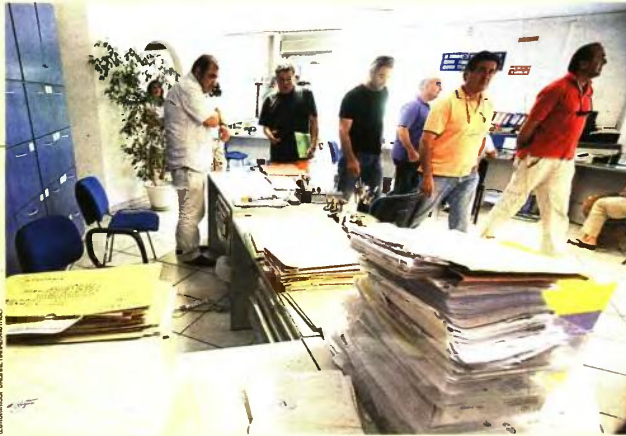
ΡΕΠΟΡΤΑΖ ΚΩΣΤΑΣ ΠΑΠΑΔΗΣ

Σε 3.725,11 ευρώ προσδιορίζεται το καθαρό ποσό (προ φόρων) της ανώτερης κύριας σύνταξης, μετά τα μέτρα που έλαβε η κυβέρνηση προκειμένου να εξαιρεθούν τα φαινόμενα απονομής υψηλών συντάξεων, κατ' εφαρμογήν του νόμου Κατρούγκαλου (4387/2016).