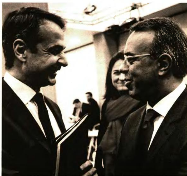
Ο πρωθυπουργός Κυριάκος Μητσοτάκης με τον υπουργό Οικονομικών Χρήστο Σταϊκούρα

Στις μακροχρόνιες προβλέψεις του το ΔΝΤ, ειδικά για την περίοδο μετά το 2020, επαναλαμβάνει μια παλαιά του εκτίμηση, ότι η ελληνική οικονομία θα «σέρνεται» με ρυθμούς χαμηλότερους από 1% το 2024.