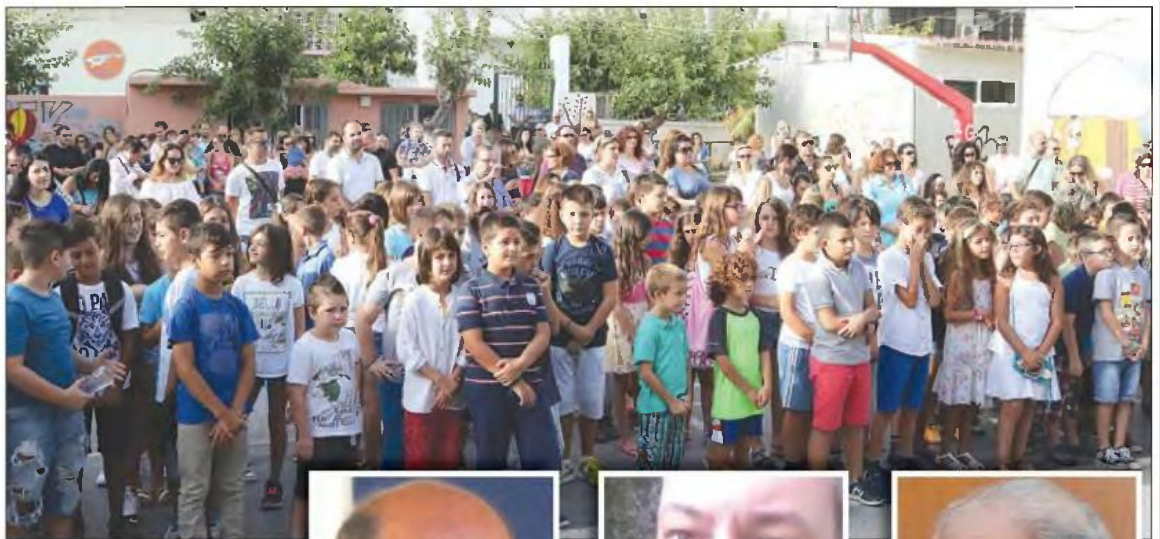
Τρομάζει η μείωση του μαθητικού πληθυσμού στα Δημοτικά του Ηρακλείου