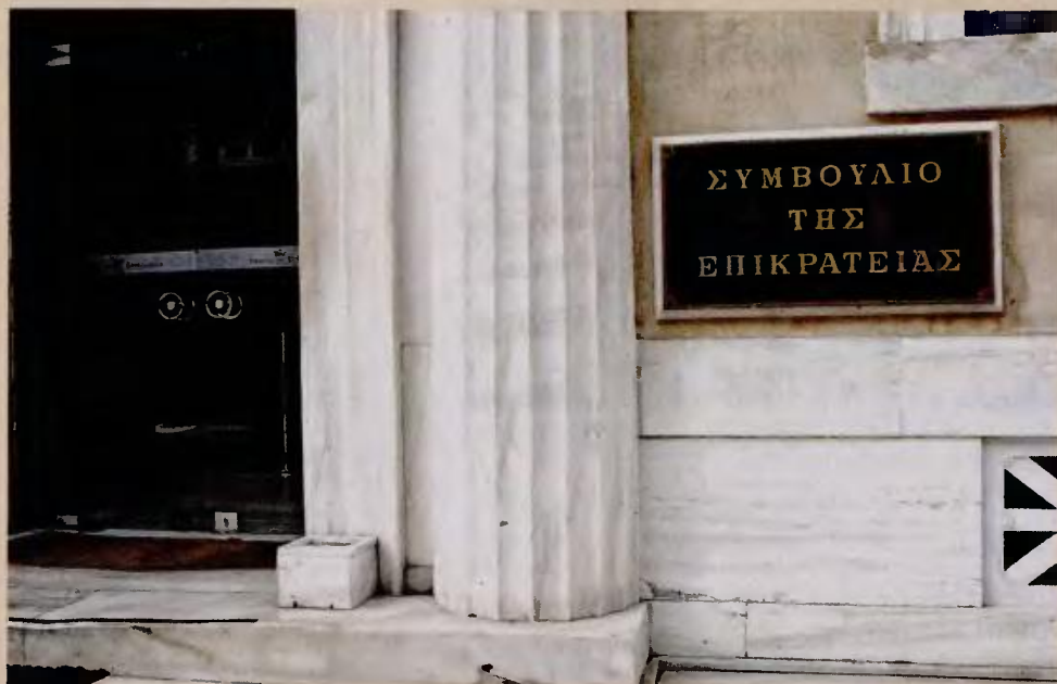
Μία από τις αποφάσεις φαίνεται πως βάζει «φρένο» στις αναδρομικές διεκδικήσεις εκατομμυρίων συνταξιούχων, με το ανώτατο ακυρωτικό δικαστήριο να μην εγείρει ενστάσεις για το ύψος των παλαιών κύριων συντάξεων.

Στο μικροσκόπιο των δικαστών έχουν τεθεί ζωτικές διατάξεις του νόμου 4387/2016, που έχει μείνει γνωστός ως νόμος Κατρούγκαλου, οι οποίες αν κριθούν αντισυνταγματικές, αναμένεται να προκαλέσουν ισχυρότατο πλήγμα όχι μόνο στον ΕΦΚΑ αλλά και στο Ενιαίο Ταμείο Επικουρικής Ασφάλισης και Εφάπαξ Παροχών (ΕΤΕΑΕΠ). Μεταξύ αυτών συγκαταλέγο-