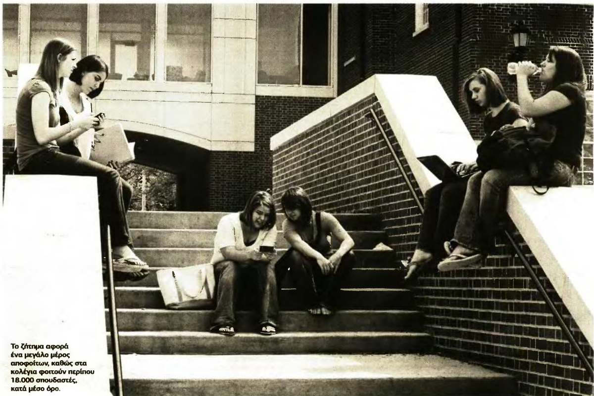
Το ζήτημα αφορά ένα μεγάλο μέρος αποφοίτων, καθώς στα κολλέγια φοιτούν περίπου 18.000 σπουδαστές, κατά μέσο όρο.

ΚΟΛΕΓΙΑ: ΑΠΛΟΠΟΙΗΣΗ ΚΑΙ ΑΡΣΗ ΑΠΟΚΛΕΙΣΜΩΝ ΜΕ ΔΙΑΤΑΞΗ ΠΟΥ ΕΡΧΕΤΑΙ ΑΜΕΣΑ ΣΤΗ ΒΟΥΛΗ