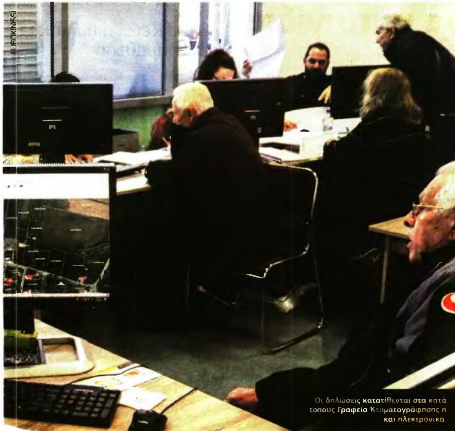
Οι δηλώσεις κατατίθενται στα κατά τόπους Γραφεία Κτηματογράφησης η και ηλεκτρονικά

ΕΛΕΥΘΕΡΟΣ ΤΥΠΟΣ ΠΑΡΑΣΚΕΥΗ 4 ΟΚΤΩΒΡΙΟΥ 2019