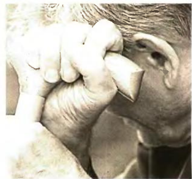
Κάθε 5 χρόνια προστίθενται στην προχωρημένη ηλικία πάνω από 100.000 άτομα

Κάθε 5 χρόνια προστίθενται στην προχωρημένη ηλικία πάνω από 100.000 άτομα. Από τους ηλικιωμένους ασθενείς που νοσηλεύονται σε γενικά νοσοκομεία το 40% είναι χειρουργικοί ασθενείς. Τα άτομα άνω των 70 ετών, ενώ αποτελούν το 10% του πληθυσμού, απασχολούν το 50% των νοσοκομειακών κλινών και ειδικότερα το 25% των κλινών για οξεία περιστατικά. Οι υπερήλικες καλύπτουν το 25% των συνολικών ημερών νοσηλείας στα νοσοκομεία. Συννοσηρότητα: Το 70% των υπερηλικών έχουν περισσότερες της μιας συνοδούς νόσους. Πολυφαρμακία: Το 25% των υπερηλικών παίρνουν περισσότερα από 5 φάρμακα.