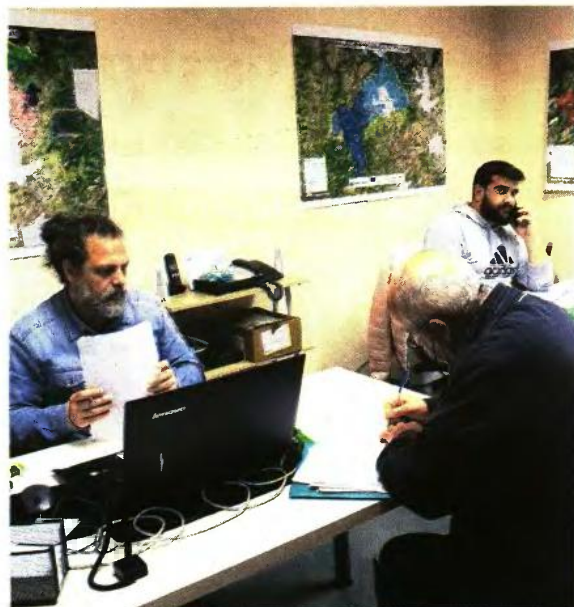
Το Κεντρικό Γραφείο Κτηματογράφησης στο Γαλάτι δεν θα παραμείνει ανοικτό μετά τη λήξη της προθεσμίας ανά πρόγραμμα, ενώ τα ανάδοχα σχήματα θα εξυπηρετούν τους εκπρόθεσμους για περίπου 10-15 ημέρες.