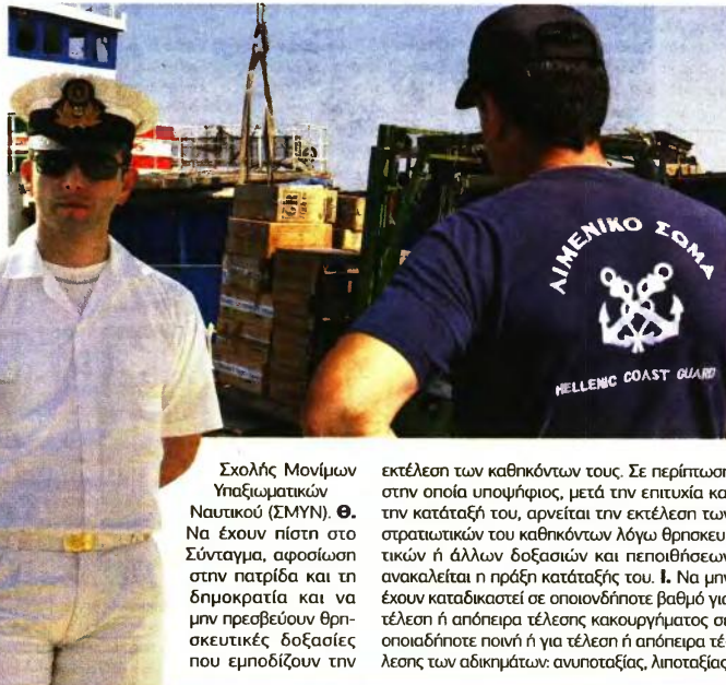
Σχολής Μόνιμων Υπαξιωματικών Ναυτικού (ΣΜΥΝ). Θ. Να έχουν πίστη στο Σύνταγμα, αφοσίωση στην πατρίδα και τη δημοκρατία και να μην προεβούν θρησκευτικές, δοξασίες που εμποδίζουν την

εκτέλεση των καθηκόντων τους. Σε περίπτωση στην οποία υποψήφιος, μετά την επιτυχία και την κατάταξη του, αρνείται την εκτέλεση των στρατιωτικών του καθηκόντων λόγω θρησκευτικών ή άλλων δοξασιών και πεποιθήσεων ανακαλείται η πράξη κατάταξής του. Ι. Να μην έχουν καταδικαστεί σε οποιοδήποτε βαθμό για τέτλεση ή απόπειρα τέτλεσης κακοουργήματος σε οποιοδήποτε ποινή ή για τέτλεση ή απόπειρα τέτλεσης των αδικημάτων: ανυποταξίας, λιστοταξίας,