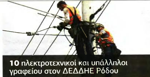
10 ηλεκτροτεχνικοί και υπάλληλοι γραφείου στον ΔΕΔΔΗΕ Ρόδου

► Η Δημοτική Κοινωνική Επιχείρηση Δήμου Καβάλας «ΔΗΜΩΦΕΛΕΙΑ» ανακοινώνει την πρόσληψη έως είκοσι πέντε (25) Πτυχιούχων Φυσικής Αγωγής, με σύμβαση εργασίας ιδιωτικού δικαίου ορισμένου χρόνου, συνολικής διάρκειας έως οκτώ (8) μηνών με ωριαία αποζημίωση, για την υλοποίηση των Γενικών και Ειδικών Προγραμμάτων «Αθλησης για Όλους» Μεγάλης Διάρκειας περιόδου 2019 - 2020. Οι ενδιαφερόμενοι μπορούν να κατεβάσουν την προκήρυξη και την αίτηση - έντυπο από την ιστοσελίδα της «ΔΗΜΩΦΕΛΕΙΑ» ( www.kavalagrece.gr ). Υποβολή δικαιολογητικών στη Διεύθυνση Αθλητισμού και Παιδείας της «ΔΗΜΩΦΕΛΕΙΑ» Πολιτιστικό Κέντρο «ΠΥΘΑΓΟΡΑΣ» 7ης Μεταρχίας 1, από τις 11/09/2019 (Τετάρτη) μέχρι και τις 20/09/2019 (Παρασκευή), κατά τις ώρες 9:00 - 14:00. Τηλέφωνο επικοινωνίας: 2510-247350.