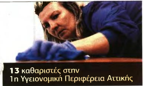
13 καθαριστές στην 1η Υγειονομική Περιφέρεια Αττικής

εφόσον η εξουσιοδότηση φέρει την υπογραφή τους θεωρημένη από δημόσια Αρχή, είτε ταχυδρομικά με συστημένη επιστολή, στα γραφεία της υπηρεσίας στην ακό-