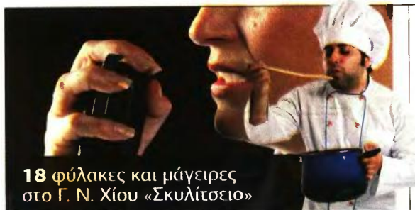
18 φύλακες και μάγειρες στο Γ. Ν. Χίου «Σκυλίτσειο»

Το Γενικό Νοσοκομείο Χίου «Σκυλίτσειο» ανακοινώνει την πρόσληψη 18 ατόμων με σύμβαση εργασίας ιδιωτικού δικαίου ορισμένου χρόνου, διάρκειας 24 μηνών, ως ακολούθως: 8 ΔΕ Φύλακες, 4 ΔΕ Μάγειρες και 6 ΥΕ Τραπεζοκόμοι. Οι ενδιαφερόμενοι καλούνται να συμπληρώσουν την αίτηση με κωδικό έντυπο ΑΣΕΠ ΣΟΧ.7 και να την υποβάλουν, είτε αυτοπροσώπως είτε με άλλο εξουσιοδοτημένο από αυτούς πρόσωπο, εφόσον η εξουσιοδότηση φέρει την υπογραφή τους θεωρημένη από δημόσια Αρχή, είτε ταχυδρομικά με συστημένη επιστολή,