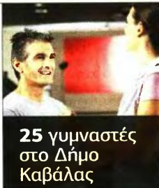
25 γυμναστές στο Δήμο Καβάλας