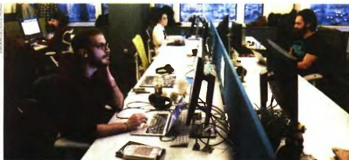
Το υπό διαβούλευση αναπτυξιακό νομοσχέδιο προβλέπει μεταξύ άλλων τη δυνατότητα των συνδικαλιστικών εταίρων να θεσπίσουν στο πλαίσιο ομοιοεπαγγελματικών και κλαδικών συμβάσεων εργασίας, ειδικούς όρους ή ακόμη και εξαιρέσεις για ορισμένες επιχειρήσεις.

Σε έξι βασικές νομοθετικές τροποποιήσεις του υπάρχοντος θεσμικού πλαισίου που αφορά τις συλλογικές και ατομικές συμβάσεις εργασίας, στη δυνατότητα υπό συγκεκριμένες προϋποθέσεις της μονομερούς προσφυγής στον ΟΜΕΔ, σε παρεμβάσεις που αποσκοπούν στην προστασία των εργαζομένων, αλλά και των συνεπών επιχειρήσεων από τον αθέμιτο ανταγωνισμό, καθώς και σε ρυθμίσεις για την ανάσχεση της υπερδηλωμένης και ανασφάλιστης εργασίας προκάρα το υπουργείο Εργασίας με το αναπτυξιακό νομοσχέδιο.