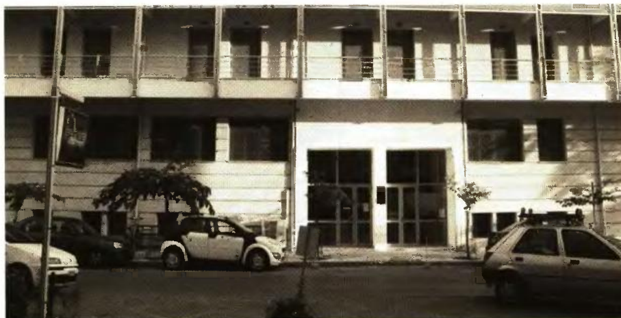
Η φοιτητική εστία στον Βόλο μπορεί να φιλοξενήσει έως 40 φοιτητές, όταν οι πρωτοετείς στην πόλη ανέρχονται σε 2.038

«Υπάρχει σημαντικός αριθμός φοιτητών που λαμβάνει το στε-