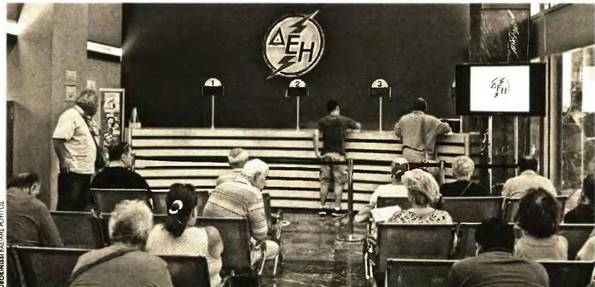
ΕΥΡΩΚΙΝΗΣΗ ΚΑΛΩΝΕ ΡΟΥΤΟΣ

Ενώ με τη μείωση της έκπτωσης στο 5% θα γλιτώνει €8,3 Δηλαδή θα έχει απώλεια 9,1 ευρώ στο τετράμηνο ή 2,2 ευρώ τον μήνα