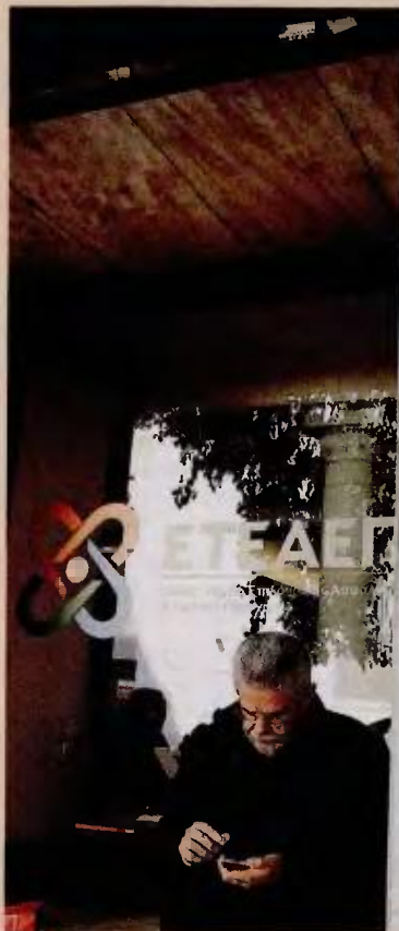
Οι παλαιοί , όσοι δηλαδή είναι σήμερα συνταξιούχοι ή ασφαλισμένοι στο ΕΤΕΑΕΠ, δεν θα υποστούν καμία αλλαγή.

Η πρώτη αφορά τον διαχωρισμό παλαιών και νέων ασφαλισμένων. Οι παλαιοί, όσοι δηλαδή είναι σήμερα συνταξιούχοι ή ασφαλισμένοι στο ΕΤΕΑΕΠ, δεν θα υποστούν καμία αλλαγή. Το νέο σύστημα θα αφορά όσους εισέλθουν στην αγορά εργασίας και πρωτοασφαλιστούν από 1/1/2021 και μετά. Κατά τη διάρκεια της συνεδρίασης, μάλιστα, ζητήθηκε από τους ειδικούς να εξετάσουν το ενδεχόμενο να μπορούν να ενταχθούν στο νέο σύστημα και παλαιοί ασφαλισμένοι μη μισθωτοί, που μέχρι σήμερα δεν έχουν δικαίωμα ή δεν έχουν επιλέξει εθελοντικά την επικουρική ασφάλιση. Από το 2021 και μετά, η επικουρική ασφάλιση θα είναι υποχρεωτική για όλους τους νέους ασφαλισμένους, είτε είναι μισθωτοί είτε όχι. Για να μην επιβαρυνθούν, δε, με πολύ υψηλές εισφορές οι ελεύθεροι επαγγελματίες - αυτοαπασχολούμενοι,