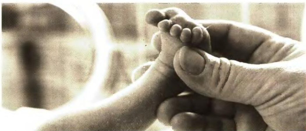
Αν δεν υπήρχαν οι γεννήσεις από αλλοδαπές γυναίκες, το φυσικό ισοζύγιο στη χώρα θα ήταν αρνητικό κατά 318.764 άτομα

Όπως καταγράφεται στην έρευνα του εργαστηρίου, οι αλλοδαπές γυναίκες συμμετέχουν με ένα σχετικά υψηλό ποσοστό στις γεννήσεις, που καταγράφονται ετησίως στη χώρα από το 2004 μέχρι και σήμερα. Με βάση τα διαθέσιμα δεδομένα οι αλλοδαπές αναπαραγωγικής ηλικίας στη χώρα αποτελούν ένα μικρό μόνον τμήμα των γυναικών ηλικίας 15 - 49 ετών μετά το 2008. Αποτελούν το 11,6% έως 9,9% των 15-49 ετών, ενώ ταυτόχρονα η μέση ηλικία τους δεν διαφέρει πλέον σημαντικά από αυτήν των Ελληνίδων. Το ποσοστό συμμετοχής των αλλοδαπών γυναικών στις καταγραφείσες γεννήσεις την περίοδο 2004-2017 στη χώρα μας ανέρχεται