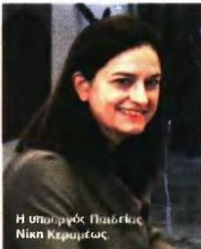
Η υπουργός Παιδείας Νίκη Κεραμέως