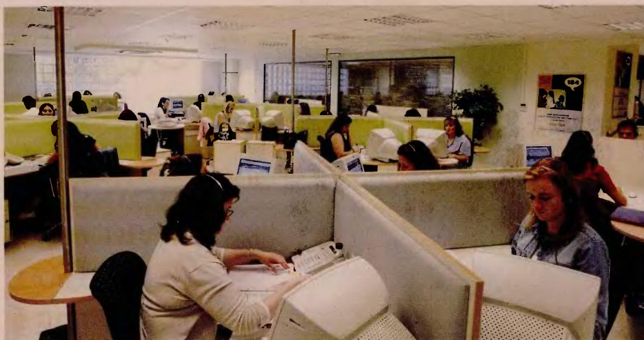
Οι γονείς ανήλικων (άνδρες και γυναίκες) ασφαλισμένοι του Δημοσίου και οι μητέρες και οι χήροι πατέρες ασφαλισμένοι στα Ταμεία των ΔΕΚΟ - τραπεζών που είχαν κατοχυρωμένο δικαίωμα συνταξιοδότησης θα πρέπει να είχαν συμπληρώσει την 25ετία μέχρι 31/12/2012.

γυναίκες) ασφαλισμένοι του Δημοσίου, καθώς και οι μητέρες και οι χήροι πατέρες ασφαλισμένοι στα Ταμεία των ΔΕΚΟ - τραπεζών που είχαν κατοχυρωμένο δικαίωμα συνταξιοδότησης θα πρέπει να είχαν συμπληρώσει την 25ετία μέχρι 31/12/2012. Επιπροσθέτως, θα πρέπει να έχουν συμπληρώσει τα αντίστοιχα όρια ηλικίας πριν από την 18η Αυγούστου 2015. Αναλυτικά μπορούν να συνταξιοδοτηθούν: 1. Μητέρες δημόσιοι υπάλληλοι και υπάλληλοι ΔΕΚΟ - τραπεζών που είχαν συμπληρώσει το 2010 την