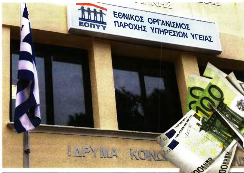
Εκείνο το ενδεχόμενο το οποίο επεξεργάζονται αρμόδια στελέχη του υπ. Εργασίας είναι η μείωση των εισφορών εργοδοτών και εργαζομένων υπέρ ΕΟΠΥΥ από 7,1% στο 5,6%.

Με αυτό τον τρόπο αναμένεται να αυξηθούν έτσι συνολικά τα ασφαλιστικά έσοδα των Ταμείων και να μειωθούν οι δημόσιες δαπάνες για τακτικά και