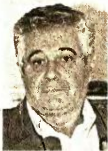
Του Θανάση Σπυρόπουλου

Η Ελλάδα ως χώρα καταρρέει δημογραφικά και κατατάσσεται ως δεύτερη γερασμένη χώρα στον πλανήτη, αφού το ποσοστό νέων παιδιών ηλικίας έως 14 ετών μειώνεται συνεχώς με δραματικό τρόπο, ενώ συγχρόνως αυξάνεται αλματωδώς και με γοργούς ρυθμούς το ποσοστό των ηλικιωμένων άνω των 65 ετών.