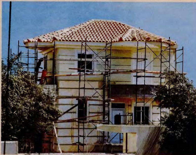
Το τεκμήριο κατοικιών κατά μέσον όρο ανέρχεται στις 3.500 ευρώ και αναμένεται να περιοριστεί στα 1.750 ευρώ.

Κάθε χρόνο εκατομμύρια φορολογούμενοι, πλούσιοι και φτωχοί, πέφτουν στην τσιμπίδα των τεκμηρίων. Χαμηλόμισθοι που διαθέτουν ένα αυτοκίνητο κα-