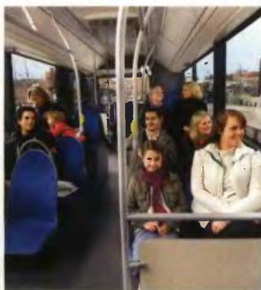
Για τα αστικά ΚΤΕΛ οι πιστώσεις για τους πολυτέκνους ανέρχονται στα 1.382.000 ευρώ.

Πρόκειται για τη δαπάνη που προκαλείται από τη, με μειωμένο κατά 50% εισιτήριο, μετακίνηση των πολυτέκνων, μόνο των κατόχων δελτίων, τα οποία χορηγεί η Ανώτατη Συνομοσπονδία Πολυτέκνων Ελλάδος (Α.Σ.Π.Ε.) στα αστικά και Υπεραστικά ΚΤΕΛ που ανήκουν στην Πανελλαδική Ομοσπονδία Αστικών Συγκοινωνιών (ΠΟΑΣ), σε βάρος του κρατικού προϋπολογισμού, συνολικού ύψους ενός εκατομμυρίου τριακοσίων ογδόντα δύο χιλιάδων ευρώ (1.382.000,00 €), συμπεριλαμβανομένου του Φ.Π.Α. για τα αστικά ΚΤΕΛ και ενός εκατομμυρίου διακοσίων ενενήντα χιλιάδων ευρώ (1.290.000,00 €), συμπεριλαμβανομένου του Φ.Π.Α. για τα Υπεραστικά ΚΤΕΛ.