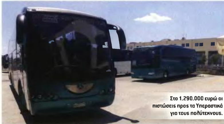
Στο 1.290.000 ευρώ οι πιστώσεις προς τα Υπεραστικά για τους πολύτεκνους.

Κ αθορίστηκε με υπ. απόφαση η πίσωψη και η κατανομή αυτής σε κάθε αστικό και Υπεραστικό ΚΤΕΛ που ανήκει στην Πανελλαδική Ομοσπονδία Αστικών Συγκοινωνιών (ΠΟΑΣ), για την κάλυψη της δαπάνης που προκαλείται από τη μεταφορά με μειωμένο εισιτήριο των πολυτέκνων οικονομικού έτους 2019.