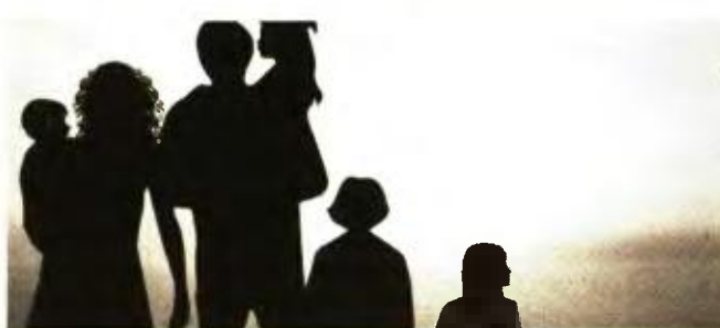
Μέτρα ελάφρυνσης και στήριξης ζητούν οι πολύτεκνοι από την Πολιτεία

Στο έγγραφό της Ανώτατη Συνομοσπονδία Πολυτέκνων Ελλάδος υπογραμμίζεται ότι: «Η νέα Κυβέρνηση προτίθεται να καθιερώσει ως αφορολόγητο 1.000 ευρώ για κάθε προστατευόμενο τέκνο στη φορολογία εισοδήματος. Η Ελληνική Στατιστική Αρχή (ΕΛΣΤΑΤ) με το δελτίο Τύπου που εξέδωσε στις 21/6/2019, ανακοίνωσε ότι τα όρια της φτώχειας είναι για τον άγαμο στα 4.718 ευρώ, αυτό το όριο προσαυξάνεται για τον έγγαμο χωρίς τέκνα κατά 50% (2.359 ευρώ) για τη σύζυγο και για