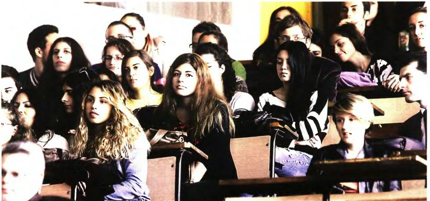
Η εισαγωγή στην Τριτοβάθμια Εκπαίδευση για φέτος θα γίνει με το υπάρχον σύστημα, στο οποίο, όπως υπογράμμισε η υπουργός, θα γίνουν «βελτιωτικές κινήσεις»