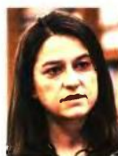
Η υπουργός Παιδείας, Νίκη Κεραμέως, δήλωσε ότι η κυβέρνηση μελετά ένα νέο θεσμικό πλαίσιο για την Πρωτοβάθμια και τη Δευτεροβάθμια Εκπαίδευση

στην Ελλάδα θα έρθουν 10.000 ξένοι φοιτητές με διδασκτρα στα υπό ίδρυση πανεπιστημιακά αγγλόφωνα τμήματα. Γενικότερα για τα θέματα της Παιδείας ανέφερε ότι δρομολογούνται οι διαδικασίες για 4.500 εκπαιδευτικούς στην Ειδική Αγωγή, ενώ σταδιακά θα αντιμετωπιστεί και το ζήτημα των αναπληρωτών καθηγητών. Τόνισε επίσης ότι στα σχολεία τον πρώτο λόγο για το περιεχόμενο των σπουδών θα τον έχουν οι εκπαιδευτικοί και όχι το υπουργείο. Προανήγγειλε επίσης ότι το πρώτο πρότυπο σχολείο της νέας γενιάς θα ιδρυθεί στο Περιστέρι.