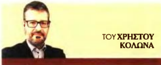
ΤΟΥ ΧΡΗΣΤΟΥ ΚΟΛΩΝΑ

Ο δεύτερος κύκλος του προγράμματος μετά την παράταση που έλαβε, ανοίγει στις 15 Σεπτεμβρίου ■ Τα βήματα που πρέπει να ακολουθήσετε για να υποβάλετε την αίτησή σας