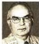
ΤΟΥ ΔΗΜΗΤΡΗ ΣΤΕΡΓΙΟΥ

Είναι αλήθεια ότι ελληνική πολύτεκνη οικογένεια βρέθηκε στο στόχαστρο εκάστοτε πρωθυπουργών, υπουργών Οικονομικών, υπουργών Κοινωνικών Ασφαλίσεων και βουλευτών μετά το 1981, αλλά μετά το 1992 πήρε προκλητικές διαστάσεις, μολοντί η προστασία της πολύτεκνης οικογένειας προβλέπεται από το άρθρο 21 παρ. 2 του Συντάγματος. Αυτή η «έχθρα» εκδηλώθηκε με πολλούς τρόπους: