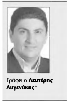
Γράφει ο Λευτέρης Αυγενάκης*

Ταυτόχρονα, εφαρμόζουμε πολιτικές για τη μείωση του βάρους για την απόκτηση παι-