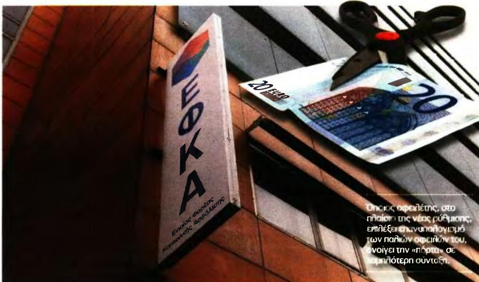
Ορισμοί οφειλέτης, στο πλαίσιο της νέας ρύθμισης, επιλέξει επανυπολογισμό των παλιών οφειλών του, ανοίγει την «πύρρα» σε χαμηλότερη σύνταξη.

■ ΑΠΟ ΤΟΝ ΔΗΜΗΤΗΡΗ ΚΑΤΣΑΓΑΝΗ katsaganis@kefalαιο.gr