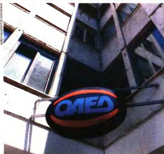
Το εκπαιδευτικό επίδομα των ωφελούμενων από τα δύο νέα προγράμματα του ΟΑΕΔ ανέρχεται συνολικά στα 2.800 ευρώ.

Επισημαίνεται ότι η κατάσταση της ανεργίας, δηλαδή το εάν ο ωφελούμενος απασχολείται νόμιμα οπουδήποτε, θα ελέγχεται αυτόματα από την ειδική ιστοσελίδα http://www.voucher.gov.gr , με τη διασταύρωση των στοιχείων που τηρούνται στα μητρώα ανεργίας του ΟΑΕΔ. Σε περίπτωση που ωφελούμενος απολέσει την ιδιότητα του εγγεγραμμένου ανέργου στα μητρώα ανεργίας του ΟΑΕΔ οποιαδήποτε