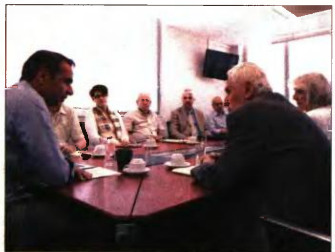
Ο Κυριάκος Μητσοτάκης με τους εκπροσώπους της Ανώτατης Συνομοσπονδίας Πολυτέκνων Ελλάδος στη χθεσινή συνάντησή τους

■ Συνάντηση Μητσοτάκη με τη Συνομοσπονδία Πολυτέκνων και δέσμευση για μέτρα ενίσχυσης