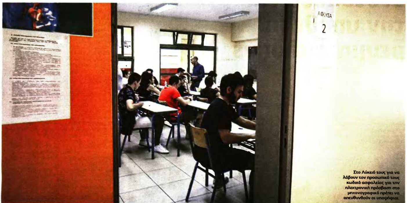
Στο Λύκειό τους για να λάβουν τον προσωπικό τους κωδικό ασφαλείας για την ηλεκτρονική πρόσβαση στο μηχανογραφικό πρέπει να απευθυνθούν οι υποψήφιοι.

ΠΡΟΣΒΑΣΙΜΟ ΑΠΟ ΣΗΜΕΡΑ ΜΕΧΡΙ ΤΗΝ ΟΡΙΣΤΙΚΗ ΥΠΟΒΟΛΗ ΤΟΥ ΣΤΙΣ 15 ΙΟΥΛΙΟΥ