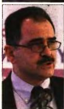
Αφρικανοί μετανάστες στην Αθήνα. Στην ένθετη φωτο: Ο αναπληρωτής καθηγητής Μαιευτικής και Γυναικολογίας - Εμβρυομητρικής Ιατρικής ΕΚΠΑ Γεώργιος Δασκαλάκης

Το 2017 σημειώθηκε αρνητικό ρεκόρ γεννήσεων σε σχέση με τους θανάτους (90.000 γεννήσεις, οι οποίες μεταφράζονται σε μείωση 4,7% σε σχέση με το 2016). Εως το 2035, η συρρίκνωση του πληθυσμού της Ελλάδας θα κυμαίνεται μεταξύ 4,1% και 12,4% σε σχέ-