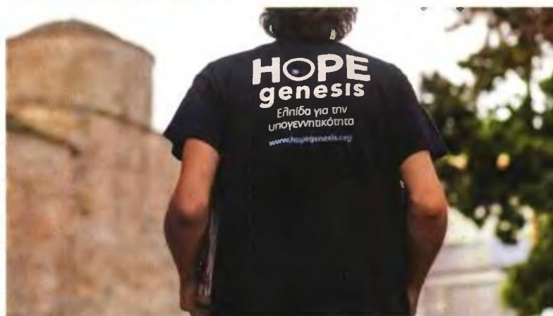
↑ Εθελοντές της HOPEgenesis επί το έργον. Ο αριθμός των ιατρών που υποστηρίζουν το έργο της οργάνωσης έχει φτάσει τους 44.