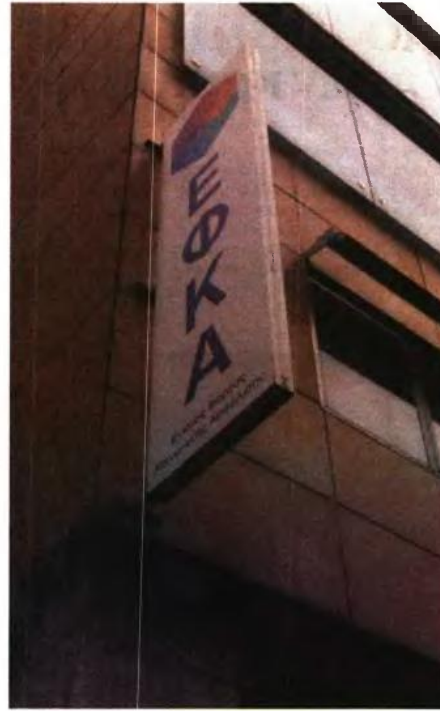
Οι διευκρινίσεις της νέας εγκυκλίου αφορούν την αξιοποίηση των ευνοϊκών ρυθμίσεων που έχει ο νόμος 4387/2016 για τις περιπτώσεις της διαδοχικής ασφάλισης σε διαφορετικά ταμεία ή της παράλληλης ασφάλισης.

Ο υπολογισμός του ποσού της σύνταξης πραγματοποιείται ως εξής: ■ μία εθνική σύνταξη για το χρόνο ασφάλισης από 1986 έως 2018 (32 έτη), ■ μία ανταποδοτική σύνταξη για το χρόνο ασφάλισης από 1986 έως 2018, και τα ποσοστά αναπλήρωσης που αντιστοιχούν για 32 έτη και το μέσο όρο των συντάξιμων αποδοχών από το 2002 έως 2018. ■ Προσαύξηση σύνταξης κατά τα προβλεπόμενα στο άρθρο 30 του ν. 4387/2016 για τον χρόνο