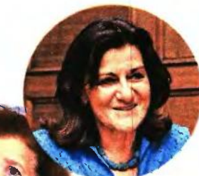
Η αναπληρώτρια υπουργός Κοινωνικής Αλληλεγγύης, Θεανώ Φωτίου, και η πρόεδρος του Κέντρου Κοινωνικής Πρόνοιας της Περιφέρειας Αττικής, Σοφία Κωνσταντέλια

Τον λόγο που πρέπει να προταχθεί ισχυρά ο θεσμός της αναδοχής και στην Ελλάδα αναλύει στη «Νέα Σελίδα» η πρόεδρος του Κέντρου Κοινωνικής Πρόνοιας Περιφέρειας Αττικής, Σοφία Κωνσταντέλια: «Στην πραγματικότητα, τα παιδιά δεν μπορούν να μας πουν τα ίδια, για παράδειγμα «δεν μπορώ να περιμένω τόσο όσο χρειάζεται μια υιοθεσία», και ότι προτιμούν την προσωρινή οικογένεια και την αναδοχή. Αυτό που πρέπει, λοιπόν, να αλλάξει στην αντίληψη των υποψηφίων γονιών είναι το εξής: η υιοθεσία δεν είναι δικαίωμα, αλλά ευκαιρία που την παίρνουν αν κάποιος φυσικός γονέας «ελευθερώσει» το παιδί του. Αναφορικά με την αναδοχή, υπάρχει έλλειψη πληροφόρησης. Για παράδειγμα, ακόμη