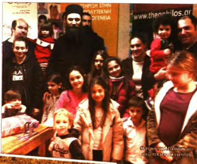
© Φεροντάζ Μεθόδιος με πολύτεκνες οικογένειες

Ο «Θεόφιλος» είναι ένας Οργανισμός Κοινωνικής Φροντίδας για τρίτεκνες και πολύτεκνες οικογένειες σε όλη την Ελλάδα, που αντιμετωπίζουν συνθήκες αποκλεισμού και φτώχειας. Από την ίδρυσή του, το 2004, μέχρι σήμερα, παρέχει στήριξη στον αγώνα τους, προσφέροντας οικονομική ενίσχυση, είδη πρώτης ανάγκης, τροφή, παιχνίδια, ιατρική φροντίδα. Επίσης, μέσα από διάφορες δράσεις επιχειρεί να δώσει λύσεις σε προβλήματα ανεργίας, μεριμνά για τη φιλοξενία φοιτητών κ.ά. Η προσπάθειά του όλα αυτά τα χρόνια στηρίζεται μόνο στην αγάπη και την προσφορά των εθελοντών που τον ενισχύουν.