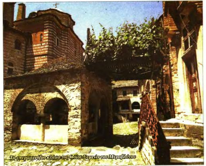
Το υπεραϊωνόβιο κλίμα του Οσίου Συμεών του Μυροβλύτου

Ο ΗΓΟΥΜΕΝΟΣ της μονής, γέροντας Μεθόδιος, θέλοντας να κάνει στους αναγνώστες της εφημερίδας περιληπτικά μια ιστορική αναδρομή στην ίδρυση της ιστορικής Μονής Χιλανδαρίου του Αγίου Ορους, αναφέρει: «Ο Οσίος μοναχός Συμεών ο Μυροβλύτης είναι ο κτήτορας της μονής μας. Υπήρξε ο Στέφανος Νεμάνια, ο μέγας ηγεμόνας της Σερβίας και ιδρυτής του σερβικού κράτους. Μεταξύ των τέκνων του ήταν και ο Άγιος Σάββας, πρώτος Αρχιεπίσκοπος των Σέρβων, κατά κόσμον Ράστικο. Σε ηλικία 16 ετών εκάρη μοναχός στο Άγιον Όρος κρυφά από τους γονείς του, οι οποίοι με την απομάκρυνσή του βυθίστηκαν σε μεγάλη θλίψη. Η μακρά παραμονή του Αγίου Σάββα στον Άθωνα και οι παραινετικές επιστολές του προς τον πατέρα του συνέβαλαν στην απόφαση του Στεφάνου να παραιτηθεί από τον θρόνο. Ο ίδιος έλαβε το μοναχικό σχήμα με το όνομα Συμεών, ενώ η σύζυγός του Άννα πήρε το όνομα Αναστασία και αποσύρθηκε στη Μονή της Μιττέρας του Χριστού στην Κουρσούμλιγια. Υπακούοντας