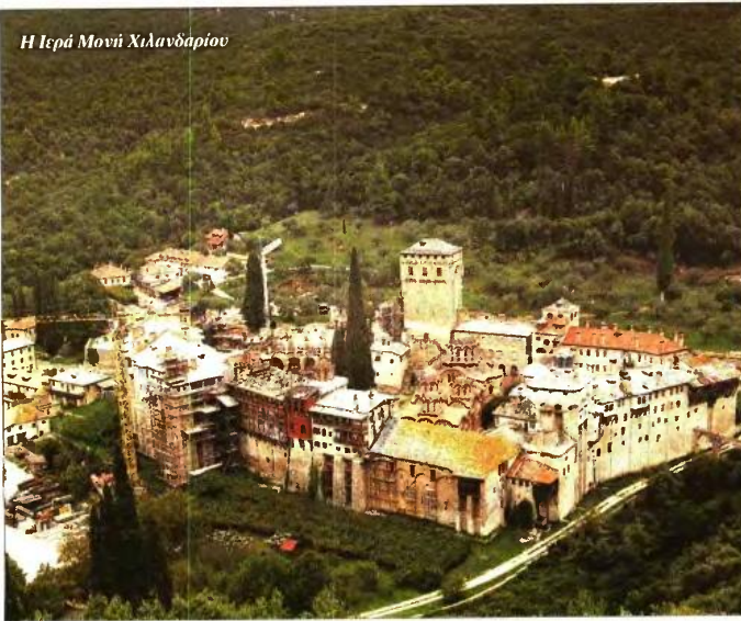
Η Ιερά Μονή Χιλανδαρίου