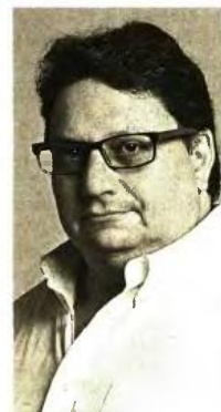
Ο καθηγητής Ψυχιατρικής – Ψυχοσωματικής Ιατρικής στο Πανεπιστήμιο Αθηνών Γιάννης Ζέρβας

Και ο Γιάννης Ζέρβας συνεχίζει: «Η νέα μητέρα οφείλει να ανταποκριθεί σε ένα ιδανικό πρότυπο: αποφασιστικότητας, δύναμης, αποθυσίας, πρόθυμης εγκατάλειψης του ερωτικού, επαγγελματικού, αυτονομίου ρόλου της, προκειμένου να γεννήσει και να μεγαλώσει ένα παιδί. Και όσο η κουλτούρα μας απομακρύνεται από ένα πρότυπο αυταπάρας (που προερχόταν από τη στέρση που χαρακτήριζε παλαιότερες εποχές) τόσο δυσκολότερη γίνεται αυτή η μετάβαση. Η νέα γυναίκα οφείλει να είναι γόνιμη, υγιής, ακούραστη, ευτυχής, βέβαιη, και πιθανώς υπάκουος στις προσδοκίες του συζύγου, της μητέρας και της πεθεράς (ίσως και του σογιού ολόκληρου). Από την άλλη, η ψυχολογική αναστάτωση, είτε ορμονική, είτε διαπροσωπικά ή ενδοψυχικά συγκρουσιακά, είναι κοινωνικά οδεθόν ανεπίτρεπτη και από τους αστοικειώτους θεωρείται ότι αποτελεί δείγμα αδύναμου χαρακτήρα».