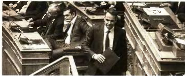
Αλέξης Τσίπρας και Κυριάκος Μητσοτάκης διασαύρωσαν τα ξίφη τους, αλλά και τις προτάσεις για τη διαχείριση του δημογραφικού προβλήματος.

Τα πεπραγμένα της Κυβέρνησης για την ενίσχυση της οικογένειας παρέθεσε ο Αλέξης Τσίπρας στη