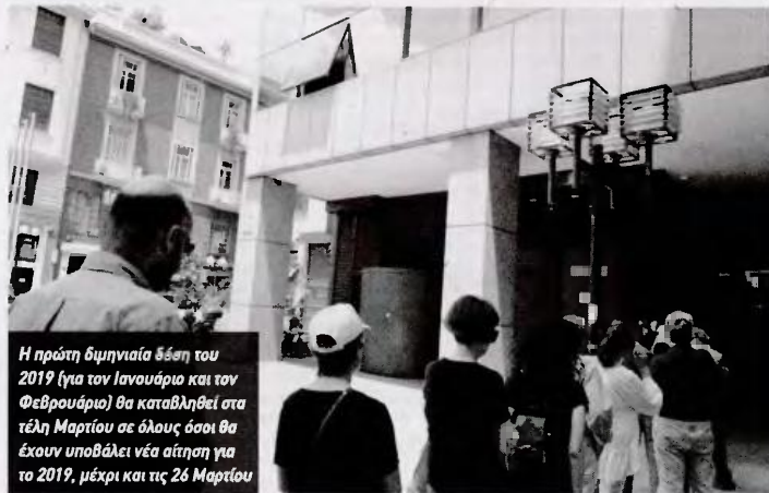
Η πρώτη διμηνιαία δόση του 2019 (για τον Ιανουάριο και τον Φεβρουάριο) θα καταβληθεί στα τέλη Μαρτίου σε όλους όσοι θα έχουν υποβάλει νέα αίτηση για το 2019, μέχρι και τις 26 Μαρτίου

Η πρώτη διμηνιαία δόση του 2019 (για τον Ιανουάριο και τον Φεβρουάριο) θα καταβληθεί στα τέλη Μαρτίου σε όλους όσοι θα έχουν υποβάλει νέα αίτηση για το 2019, μέχρι και τις 26 Μαρτίου. Για τη χορήγηση της δόσης του α΄ μήνου 2019, θα ληφθεί υπόψη το συνολικό οικογενειακό εισόδημα που οι δικαιούχοι είχαν το φορολογικό έτος 2017 (περυσινή φορολογική δήλωση). Το δικαιούμενο ποσό θα υπολογιστεί, βάσει των εξαρτώμενων τέκνων, που θα δηλωθούν φέτος στο Α21 του 2019. «Όπως και πέρυσι, οι τεχνικές δυνατότητες της νέας πλατφόρμας εγγυώνται πως το σύνολο των δικαιούχων που επιθυμούν να υποβάλουν εγκαίρως αίτηση Α21, θα έχουν τη δυνατότητα να το κάνουν» αναφέρει ο ΟΠΕΚΑ.