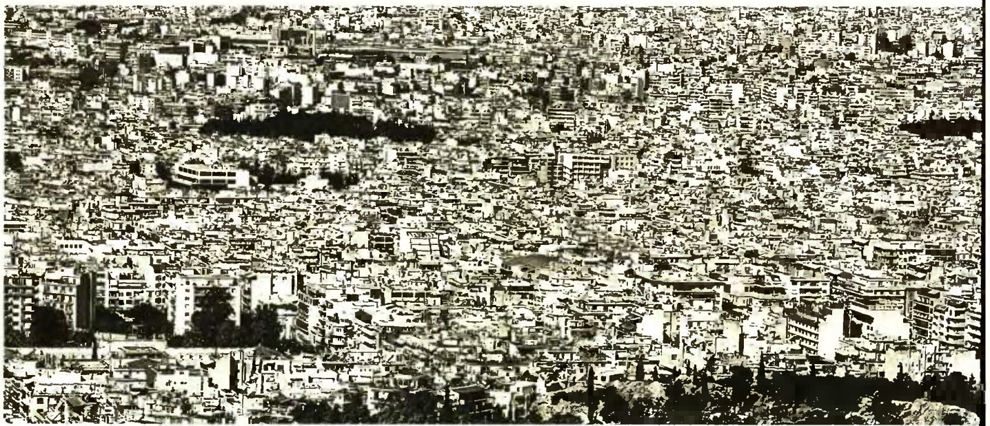
ΕΥΡΩΚΙΝΗΣΗ ΓΙΟΡΓΟΣ ΣΤΕΡΓΙΟΠΟΥΛΟΣ

Όπως ορίζεται στην απόφαση, οι δικαιούχοι που πληρούν τις προϋποθέσεις θα λάβουν το επίδομα αναδρομικά από την 1η Ιανουαρίου 2019. Ειδικότερα, σύμφωνα με την απόφαση για τις αιτήσεις που θα υποβληθούν τον Μάρτιο και τον Απρίλιο, το δικαίωμα στην καταβολή του επιδόματος ισχύει από 1/1/2019 και καταβάλλεται στο σύνολό του ως