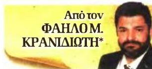
Από τον ΦΑΗΛΟ Μ. ΚΡΑΝΙΔΙΩΤΗ*

γυναικών, των παιδιών, των ομοφυλοφίλων και κάθε μη μουσουλμάνου έρχονται σε ευθεία σύγκρουση με τον ευρωπαϊκό νομικό πολιτισμό και τα καλώς εννοούμενα συμφέροντα των ευρωπαϊκών εθνών. Οι παλιές αποικιακές δυνάμεις που εισήγαγαν εκατομμύρια μουσουλμάνους, ως εργατικά χέρια, ή επέτρεψαν τη μετανάστευσή τους και μετά την αρχή της δύσης της ευρωπαϊκής βιομηχανίας κατάφεραν απλά να δημιουργήσουν παράλληλες κοινωνίες , ήτοι γκέτο. Σήμερα τα προβλήματα αυτών των γκέτο, με τις μάζες αναφομιώτων ανθρώπων, σε συνδυασμό με τη φτώχεια και την αδυναμία πολιτισμικής ενσωμάτωσης, είναι εκρηκτικά . Δημιουργήθηκαν κοινωνικές συνθήκες που αποτελούν θερμκήλιο για την καλλιέργεια της ισλαμικής τρομοκρατίας . Μην ξεχνάτε πως π.χ. στη Γαλλία, στην