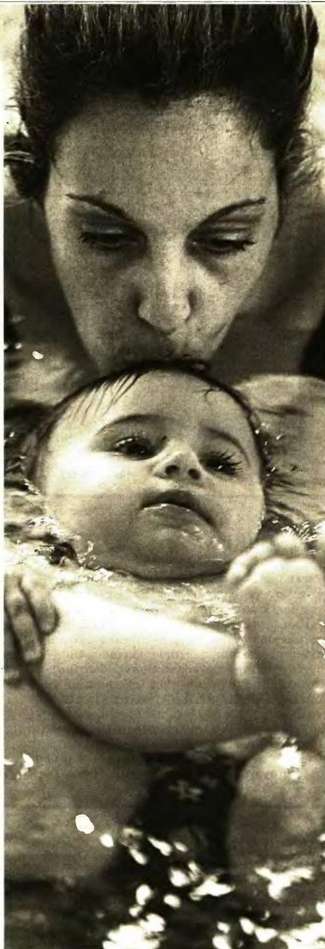
Μητέρα με το μερικών μηνών μωράκι της σε μαθήματα βρεφικής κολύμβησης

Έτσι, το 2014 ιδρύθηκε και στην Ελληνική Ψυχιατρική Εταιρεία ένας κλάδος με αυτό το ειδικό αντικείμενο ενώ το 2017, από τον Γιάννη Ζέρβα πάντα, η Εταιρεία Ψυχικής Υγείας της Γυναίκας, προκειμένου να οργανωθούν και να προωθη-