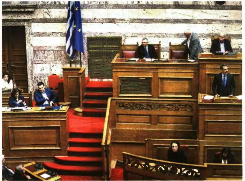
Ο κ. Μητσοτάκης επισημάνοντας τη σπουδαιότητα του προβλήματος τόνισε πως το δημογραφικό, επειδή δεν είναι ένα εθνικό αλλά ένα πανευρωπαϊκό θέμα, θα το θέσει ως ειδική προτεραιότητα στην ευρωπαϊκή ατζέντα.

Ειδικότερα επισήμανε ότι τα σοφιστικά επιδόματα με τη μορφή φιλοδωρήματος δεν συνιστούν πολιτική για τους νέους που θέλουν να κάνουν οικογένεια. Για τη Ν.Δ. η κεντρική της επιδίωξη επισήμανε ότι είναι η δημιουργία πολλών χιλιάδων νέων, καλοπληρωμένων θέσεων εργασίας σε μια οικονομία, η οποία θα αναπτύσσεται με ρυθμούς διπλάσιους από τους σημερινούς. Δεσμεύτηκε ότι ως πρωθυπουργός θα θεσπίσει άμεση ενίσχυση 2.000 ευρώ για κάθε νέο παιδί που θα γεννιέται στην πατρίδα μας. Το αφορολόγητο θα αυξηθεί κατά 1.000 ευρώ για κάθε παιδί. Θα δοθούν πρόσθετα κίνητρα σε ζευγάρια που τεκνοποιούν νωρίτερα από τα τριάντα χρόνια της γυναίκας. Όλα τα βρεφικά είδη, υγιεινής και πρώτης ανάγκης και για τις μητέρες θα υπαχθούν στον χαμηλό συντελεστή ΦΠΑ. Παιδικόι σταθμοί θα υπάρχουν για όλα τα Ελληνόπουλα και όποια οικογένεια δεν θα βρει θέση σε δημοτικό σταθμό θα μπορεί να λαμβάνει ένα κουπόνι ύψους 180 ευρώ για δέκα μήνες τον χρόνο, ώστε να επιλέγει εκείνη τον σταθμό που προτιμά. Διευκρινιστική αγωγή. Ελεύθερη επιλογή της γυναίκας να ορίσει εκείνη τον χρόνο της άδειας εγκυμοσύνης και λοχείας. Προστασία της από απόλυση για τους είκοσι τέσσερις μήνες, αντί των δεκαοκτώ μετά τον τοκετό. Δημιουργία