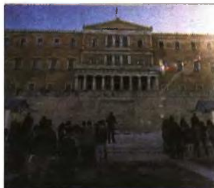
Εξωτερική άποψη της Βουλής των Ελλήνων

ΤΟ ΔΗΜΟΓΡΑΦΙΚΟ, ένα από τα μεγαλύτερα προβλήματα της σύγχρονης Ελλάδας, έχει πράγματι επιδεινωθεί τα χρόνια της κρίσης, εντούτοις σε καμία περίπτωση δεν αποτελεί σημερινό ζήτημα. Μπορεί να συζητήθηκε, επιτέλους, χθες στη Βουλή και να κατατέθηκαν σημαντικές προτάσεις από την πλευρά των κομμάτων (οριακά μπορούν να χαρακτηριστούν και ως προεκλογικές εξαγγελίες), ωστόσο το θέμα έχει ξανασυζητηθεί στη Βουλή, και μάλιστα εκτενώς, πριν από 25 ολόκληρα χρόνια!