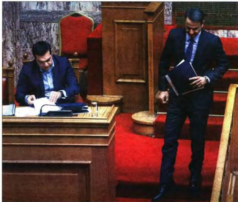
Αλ. Τσίπρας - Κ. Μητσοτάκης στη χθεσινή συζήτηση στη Βουλή για το Δημογραφικό

Από την πλευρά του, ο Κυριάκος Μητσοτάκης παρέθεσε αναλυτικά τις προτάσεις του κόμματός του, εξαγγέλλοντας επίδομα 2.000 ευρώ στις νέες οικογένειες για κάθε παιδί. Ζήτησε ακόμη να μη μένει κανένα παιδί εκτός παιδικών σταθμών, προτείνοντας όσοι δεν βρίσκουν θέση σε δημόσιο σταθμό να λαμβάνουν μηνιαίο επίδομα 180 ευρώ για να παιγνίσουν σε ιδιωτικό. «Το δημογραφικό πρόβλημα της χώρας απαιτεί εθνική συναίνεση και πολιτικές με το βλέμμα στραμμένο στο μέλλον, και όχι φωτοβολίδες της στιγμής» τόνισε ο Κυριάκος Μητσοτάκης, προτείνοντας την άμεση νομοθέτηση μέτρων, όπως η αύξηση του αφορολογητού κατά 1.000 ευρώ για κάθε παιδί, την ενίσχυση του θεσμού των ολοήμερων σχολείων, καθώς και την υπαγωγή όλων των βρεφικών ειδών στον χαμηλό συντελεστή ΦΠΑ.