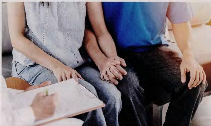
Ανάμεσα στα κριτήρια, έχουν τεθεί και συγκεκριμένες οικονομικές προϋποθέσεις για τα ενδιαφερόμενα ζευγάρια: το ετήσιο οικογενειακό εισόδημά τους να μην ξεπερνά τις 10.000 ευρώ, η ακίνητη περιουσία να αξίζει λιγότερο από 100.000 ευρώ και οι τραπεζικές καταθέσεις να βρίσκονται κάτω από τις 13.000 ευρώ.

Αφού συμπληρώσουν τη σχετική ηλεκτρονική αίτηση, οι ενδιαφερόμενοι θα αξιολογούνται από μια διε-