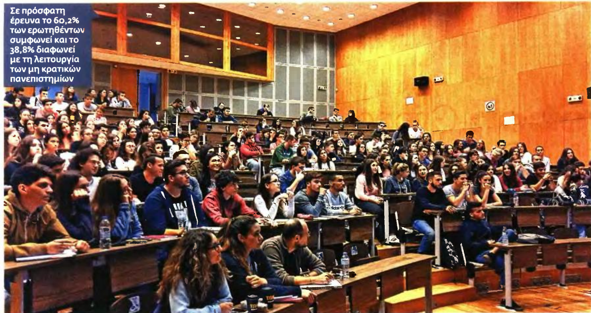
Σε πρόσφατη έρευνα το 60,2% των ερωτηθέντων συμφωνεί και το 38,8% διαφωνεί με τη λειτουργία των μη κρατικών πανεπιστημίων

Οι δημογραφικές αναλύσεις παρουσίασαν πως αυτοί που διαφωνούν είναι οι νέοι 17-24 ετών (49,1%), τα άτομα με πρωτοβάθμια μόρφωση (45,8%) και οικονομική δυνατότητα που προσδιορίζεται από τη φράση «δεν τα βγάζω πέρα» (52,8%).