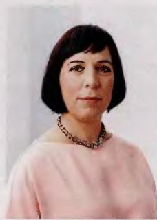
Η υπουργός Έρευνας και Εκπαίδευσης της Εσθονίας Mailis Reps.

Το αποτέλεσμα αυτής της προεργασίας, εκτός από την ωρίμανση