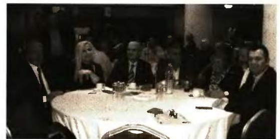
Εκπρόσωποι των τοπικών αρχών στην εκδήλωση