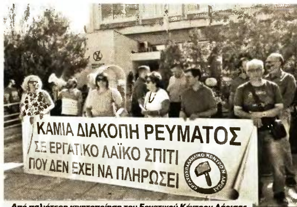
Από παλιότερη κινητοποίηση του Εργατικού Κέντρου Λάρισα

Σε απόγνωση βρίσκονται χιλιάδες χρεωμένα λαϊκά νοικοκυριά, από τα οποία η ΔΕΗ ΑΕ έχει κόψει το ρεύμα ή απειλεί ότι θα προχωρήσει σε διακοπή ηλεκτροδότησης, για οφειλές τους εξαιτίας της αντικειμενικής αδυναμίας τους να πληρώσουν τους λογαριασμούς.