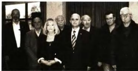
Εκπρόσωποι των πολυτέκνων στην προχθεσινή εκδήλωση της τοπικής Ένωσης

Β όμβα στα θεμέλια της οικογένειας είναι η πολιτική που υιοθετείται, με το δημογραφικό πρόβλημα να λαμβάνει ανησυχητικές διαστάσεις, καθώς οι θάνατοι υπερβαίνουν κατά 30.000 τις γεννήσεις σε ετήσια βάση. Τα παραπάνω υπογραμμίστηκαν στην προχθεσινή εκδήλωση της Ένωσης Πολυτέκνων Μαγνησίας στο «Ξενία» Βόλου, με τους διοργανωτές να κρούουν τον κώδωνα του κινδύνου για την προτεινόμενη τροποποίηση του Συντάγματος, που διασαλεύει τα θεμέλια της οικογένειας, όπως αναφέρθηκε μεταξύ άλλων.