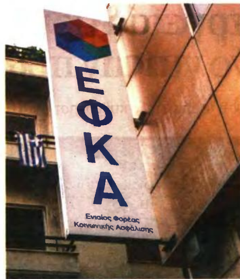
Σύμφωνα με την εγκύκλιος ως ημερομηνία έναρξης εφαρμογής των διατάξεων ορίζεται η 1η Ιανουαρίου του 2017, δηλαδή η ημερομηνία έναρξης της λειτουργίας του ΕΦΚΑ.

Στην περίπτωση αυτή, οι προϋποθέσεις θα πρέπει να συντρέχουν κατά την ημερομηνία λήξης της προηγούμενης εξαιρέσεως, προκειμένου να καλυφθεί αναδρομικά η νέα δωδε-