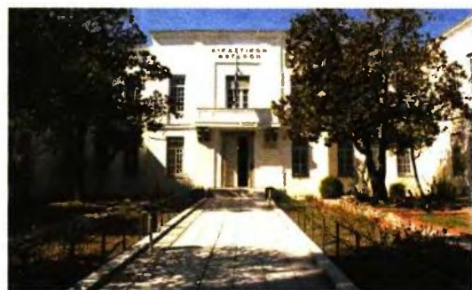
Καταθέσεις θα λάβει ο παισιματοδίκης Βόλου από τους προϊσταμένους των Ληξιαρχείων

Την ίδια περίοδο είχαν απασχολήσει άλλα δύο περιστατικά, ενώ παρόμοια περίπτωση είχε αποκαλυφθεί και στη Βέροια. Εξάλλου πέραν των εικονικών δηλώσεων εκούσιας αναγνώρισης πατρότητας τέκνων δεκάδες είναι πανελλαδικά και οι εικονικοί γάμοι.