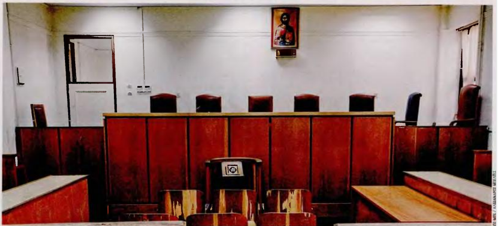
Υποψήφιος για μία από τις 404 θέσεις γραμματέων στα δικαστήρια κατέθεσε τη μεταπτυχιακή του εργασία με θέμα την «Καπνοβιομηχανία Ματσόγγος εν Βόλω 1918-1972» και απορρίφθηκε. Έτερος υποψήφιος με εργασία «Από την ένοπλη αναμέτρηση στον στόχο της συμφιλίωσης: Το ΕΑΜ Χίου 1943-1948» έγινε δεκτός.

Για να διασφαλιστεί ότι θα προσληφθούν οι υπηρετούντες στα νοσοκομεία, ο αναπληρωτής υπουργός Υγείας Παύλος Πολάκης ζήτησε να αυξηθούν τα μόρια των υπηρετούντων στο τριπλάσιο για την προϋπηρεσία σε σχέση με τα ήδη αυξημένα μόρια που είχαν οι υπάλληλοι των δήμων (308 μόρια οι υπάλληλοι των δήμων έναντι 960 μορίων αυτών του υπουργείου Υγείας). Μάλιστα, με την τροπολογία 1914 που κατατέθηκε αυτή την εβδομάδα στη Βουλή,