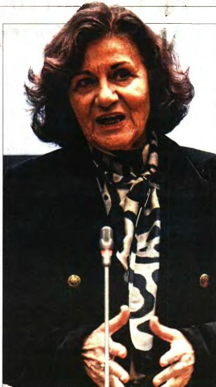
Η υπουργός Κοινωνικής Ασφάλισης Θεανώ Φωτίου

• Στα 21.000 ευρώ είναι το ανώτατο πλαφόν ετήσιου εισοδήματος.