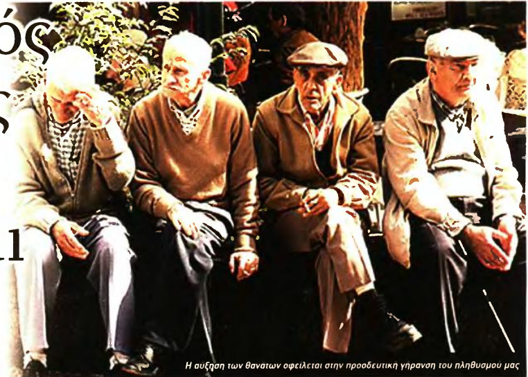
Η αύξηση των θανάτων οφείλεται στην προοδευτική γήρανση του πληθυσμού μας

Η μείωση του πληθυσμού στην Ελλάδα που ξεκίνησε από τις αρχές της τρέχουσας δεκαετίας συνεχίζεται απρόσκοπτα. Στη μείωση αυτή συμβάλλει σημαντικά το ισοζύγιο γεννήσεων και θανάτων που είναι όλο και περισσότερο αρνητικό.