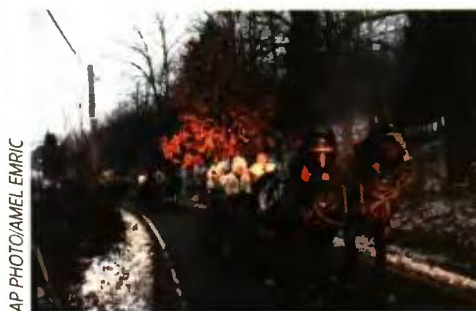
■ Χθες, κοντά στην πόλη Μπάνια Λούκα Σέρβοι ορθόδοξοι χριστιανοί, του παλιού ημερολογίου, συμμετέχουν στην παραδοσιακή τελετή της παραμονής των Χριστουγέννων

📍 Προβλήματα παραοικονομίας στην αναδυόμενη ελληνική αγορά ακινήτων διαπιστώνει η «Καθημερινή» : «Καθώς η ζήτηση για νεόδμητα ακίνητα "στα σχέδια" αρχίζει να υφίσταται ξανά έπειτα από αρκετά χρόνια, επιστρέφουν και οι κακές συνθήκες των εργολάβων, που στα χρυσά χρόνια της κτηματαγοράς πριν από την κρίση ήταν ο κανόνας. Πολλοί εργολάβοι ζητούν σημαντικό μέρος του τι-