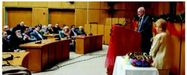
Τελετή βράβευσης των νέων φοιτητών από το Σύλλογο Πολυτέκνων Πύργου και Περιχώρων