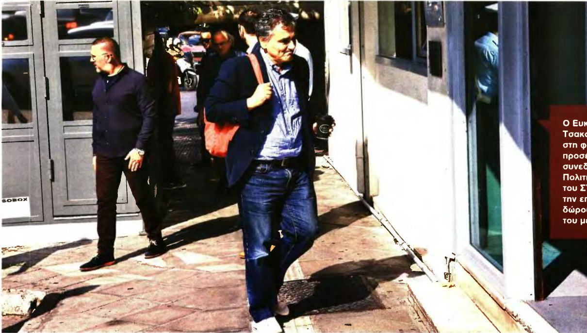
Ο Ευκλείδης Τσακαλώτος, που στη φωτογραφία προσέρχεται στη συνεδρίαση της Πολιτικής Γραμματείας του ΣΥΡΙΖΑ, αρνήθηκε την επαναφορά του δώρου στη συνάντησή του με την ΑΔΕΔΥ