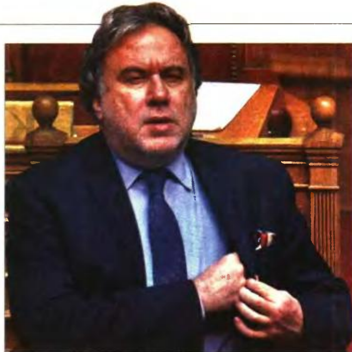
Ο Γιώργος Κατρούγκαλος

Συγκεκριμένα, στην απόφαση «βόμβα» του ΑΕΔ, που εκδόθηκε επί αγωγής που κατατέθηκε τον Νοέμβριο του 2017 (μετά την ψήφιση του νόμου Κατρούγκαλου και τις τροποποιήσεις του ν. 4472/2017), αναφέρεται, μεταξύ άλλων: «Οι διατάξεις του άρθρου πρώτου παρ. Β υποπαρ. Β.3 του ν. 4093/2012, οι οποίες ελήφθησαν υπόψη και για τον επανυπο-