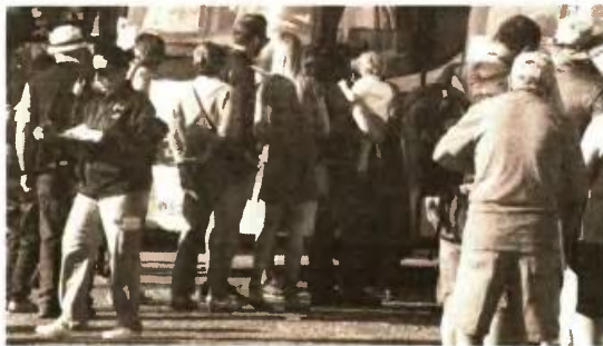
Για το επιδοτούμενο εκδρομικό πρόγραμμα ο αριθμός ανέρχεται στα δώδεκα χιλιάδες πεντακόσια (12.500) άτομα.

[από 2 Ιουλίου] Στις 223.750 οι δικαιούχοι